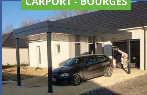
CARPORT - BOURGES