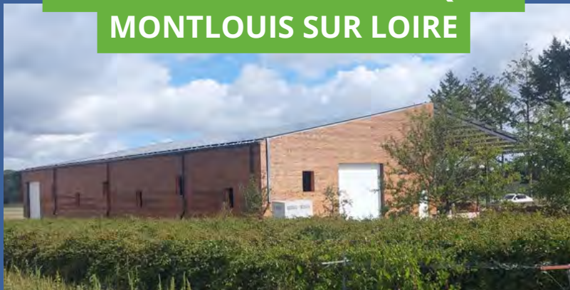
CONSTRUCTION METALLIQUE - MONTLOUIS SUR LOIRE