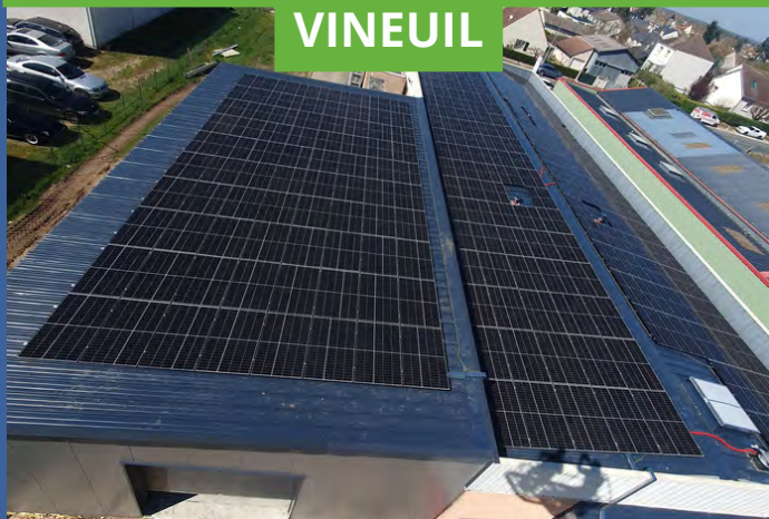
POSE SUR TOITURE EXISTANTE - VINEUIL